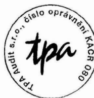
TPA Audit s.r.o. Antala Staška 2027/79, Praha 4 číslo oprávnění 080 KAČR